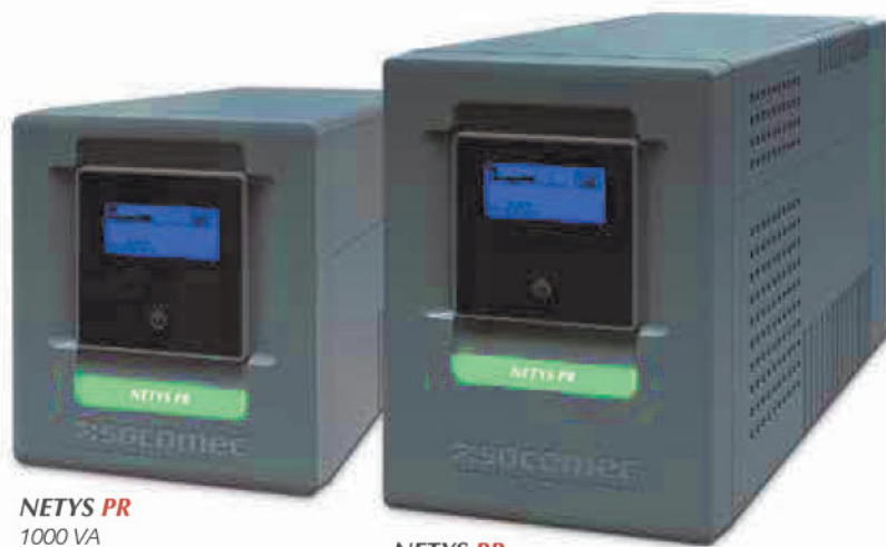
NETYS PR 1000 VA