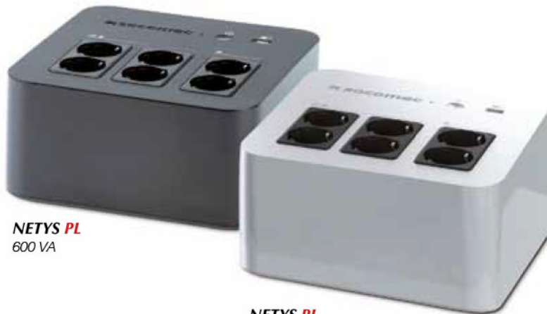
NETYS PL 600 VA